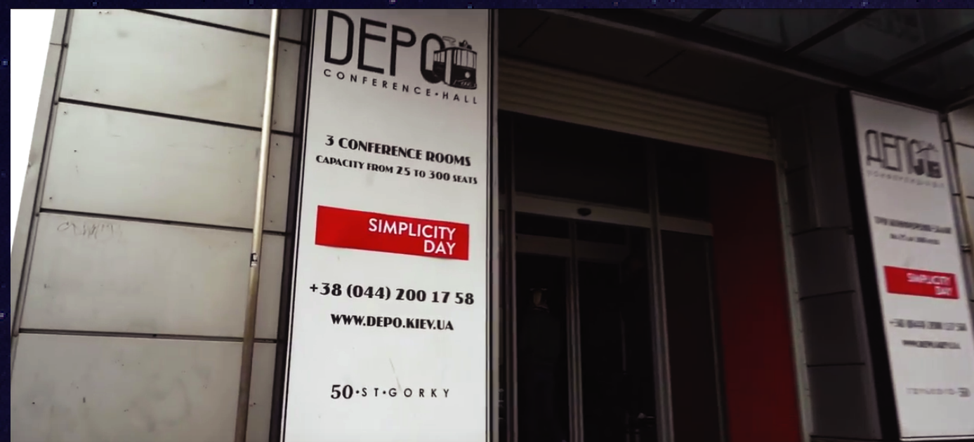
Simplicity Day. Agile&QA 2018 https://youtu.be/5pu9AARUlc0