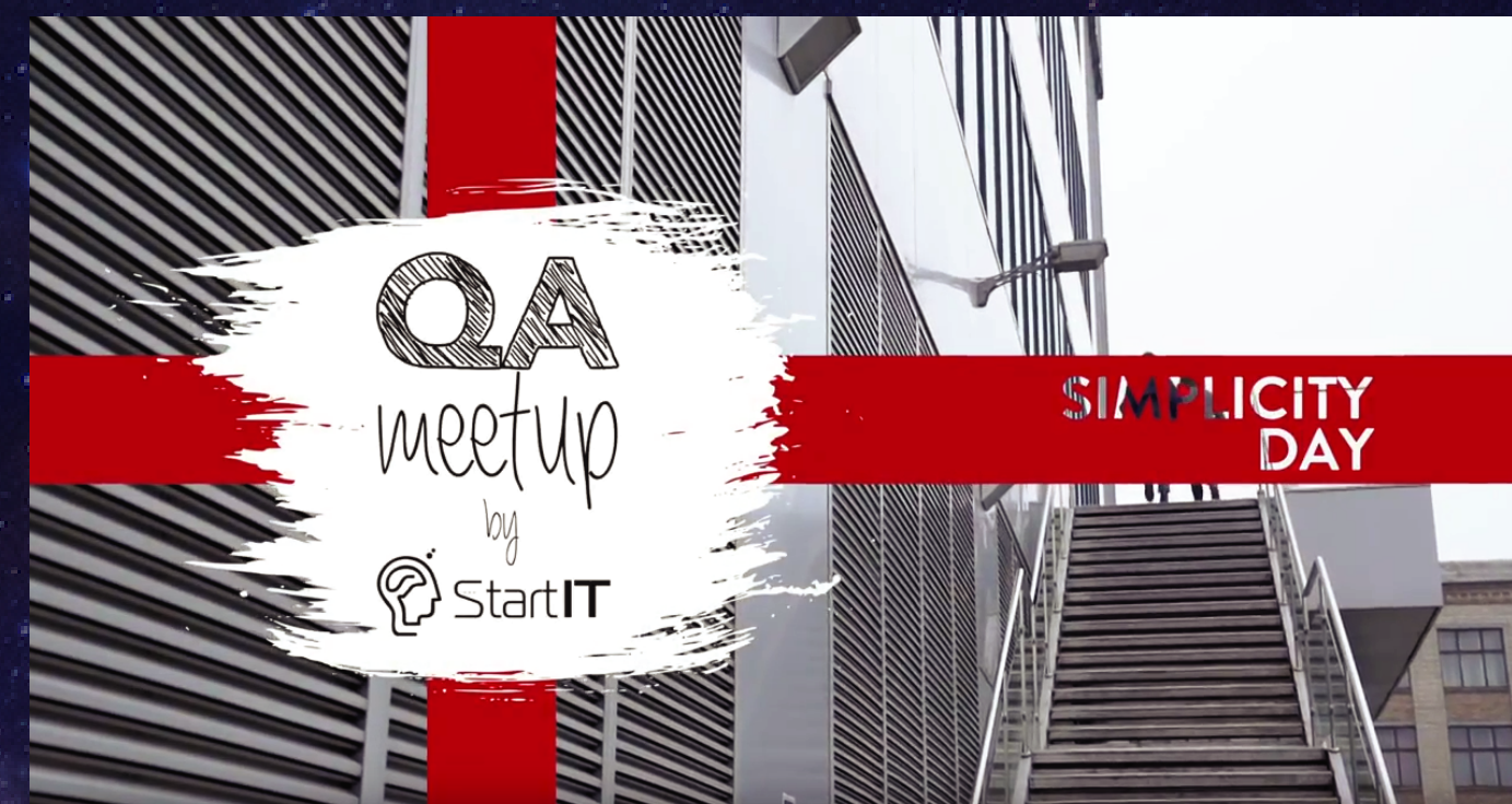
Simplicity Day. QA Meetup 2017 https://youtu.be/KbZ0hEDiuPM