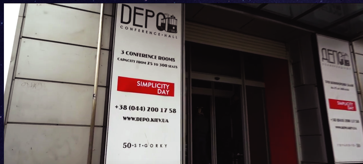
Simplicity Day. Agile&QA 2018 https://youtu.be/5pu9AARUlc0