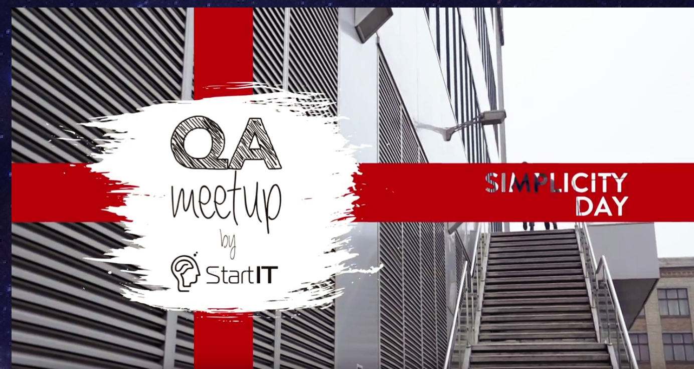
Simplicity Day. QA Meetup 2017 https://youtu.be/KbZ0hEDiuPM