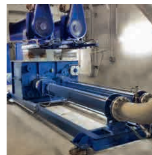
Подача обезвоженного осадка сточных вод: винтовой насос KL80RQ110.4 + 110.4