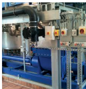
Перекачивание шлама из сточного бассейна в силосную башню: насос KL65RÜ80.4 ESP с контролем уровня заполнения