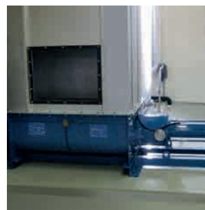
Перекачивание обезвоженного осадка сточных вод из сточного бассейна на осушение: винтовой насос KL65R80.2 Triplex