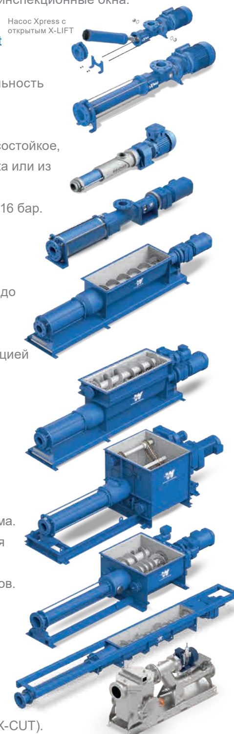
Насос Xpress с открытым X-LIFT

Модульная система используется в тех случаях, когда посторонние предметы и мусор должны быть удалены (X-TRACT) и измельчены (X-CUT).