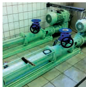
Перекачивание жидкого шлама: Винтовой насос KL50S

огромные требования к используемым насосам. Мы предлагаем комплексную программу надежных и эффективных насосов, которые удовлетворяют этим требованиям. Специальные разработки для транспортировки сильно обезвоженного осадка дополняют наш ассортимент. Таким образом, мы помогаем поддерживать бесперебойную работу станции очистки сточных вод.