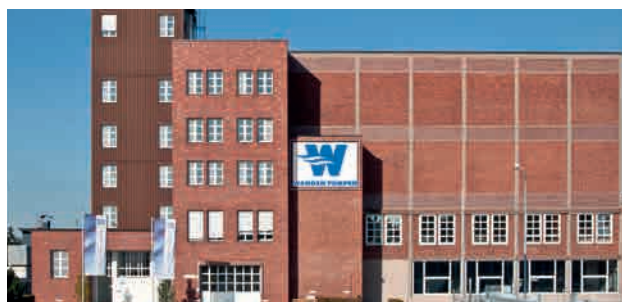
Головной офис в г.Ванген

Высокая оценка клиентов мотивирует нас на дальнейшее устойчивое развитие и улучшение день за днем.