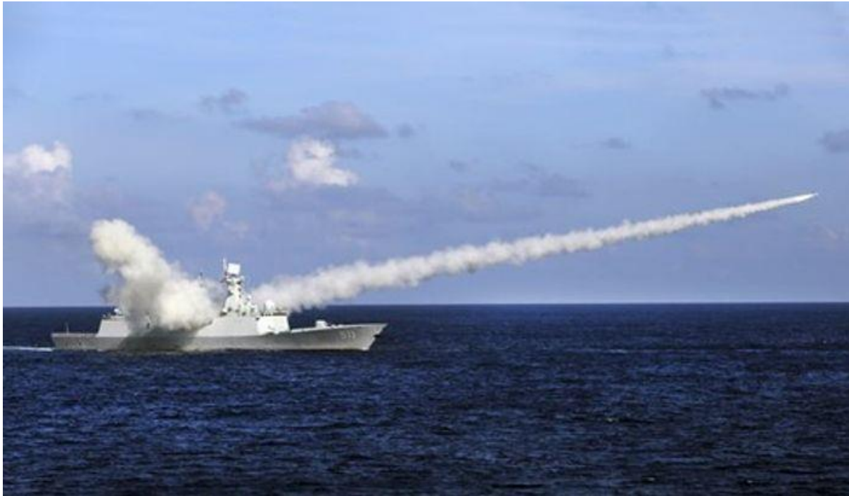
Фрегат ВМС Китаю на військових навчаннях в Південнокитайському морі.

Зрештою, AUKUS вочевидь призведе до загострення американсько-китайського протистояння та дестабілізації Азійсько-Тихоокеанського регіону. Створення оборонного альянсу є кроком до посилення військової присутності США і його союзників у регіоні. Будь-які подальші активні військові маневри та ініціативи Вашингтона будуть зустрічати жорсткий опір Пекіна, який не буде миритися з посиленням свого екзистенційного противника. Китай може збільшити присутність своїх військ у Південнокитайському морі, зокрема в акваторіях спірного архіпелагу Спратлі та Парасельських островів, проводити більш агресивні та показові акції щодо Тайваню та вдаватися до більш жорсткої політики щодо своїх сусідів.