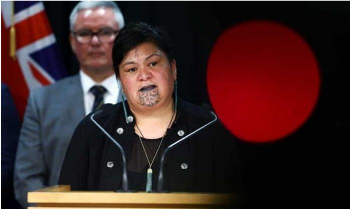
Міністерка закордонних справ Нової Зеландії Наная Магута, 2021 р.

Уряд Нової Зеландії, однак, не є байдужим до проблеми порушення прав людини в Китаї. У 2020 році країна призупинила дію взаємної угоди про екстрадицію з Гонконгом, оскільки Китай прийняв закон про попередження заворушень у цьому особливому адміністративному районі. Це викликало обурення з боку уряду КНР, який розцінив дії Нової Зеландії як втручання у його внутрішні справи. Бажання балансувати між підтримкою стабільних економічних відносин з Китаєм та критикою авторитарних дій Пекіна ставить Веллінгтон у складне положення. Погіршення відносин з Китаєм становитиме неабияку загрозу економічним інтересам новозеландців.