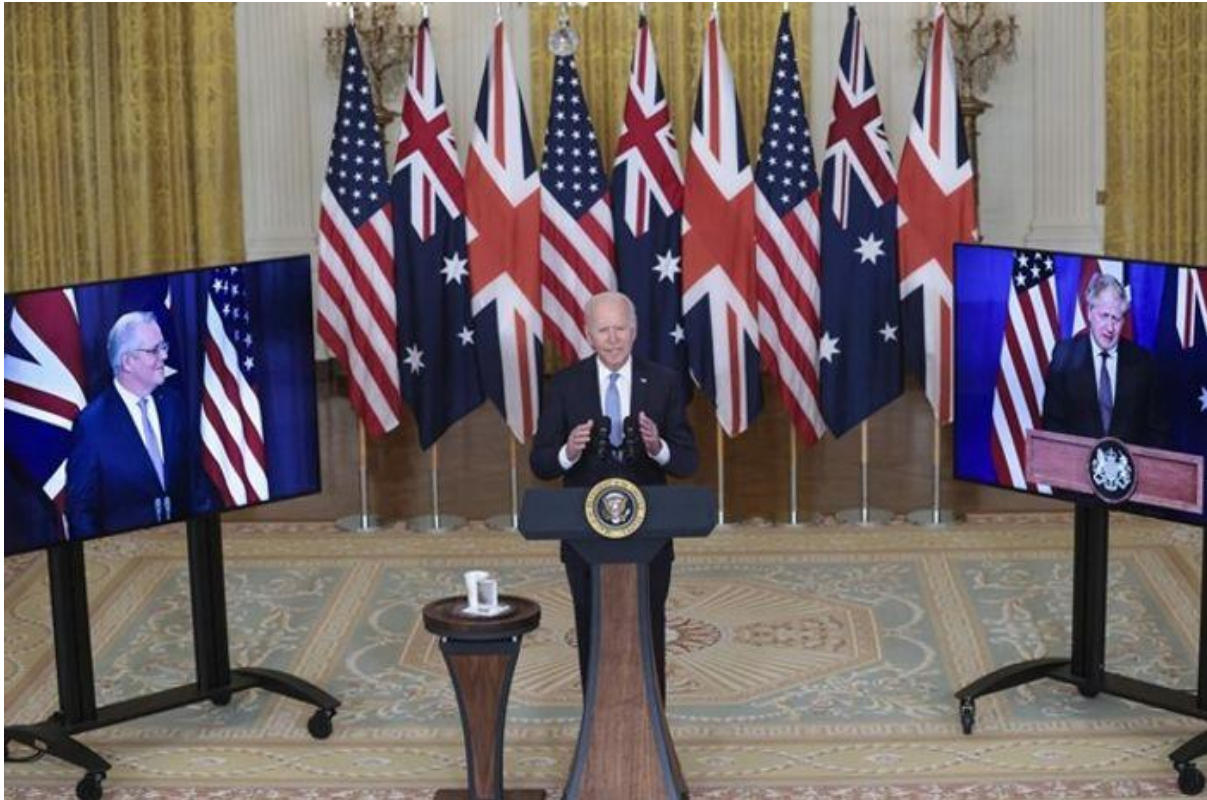
Прем'єр-міністр Австралії Скотт Моррісон (на екрані ліворуч), президент США Джозеф Байден та прем'єр-міністр Великої Британії Борис Джонсон (на екрані праворуч) на конференції, присвяченій створенню AUKUS. 15 вересня 2021. EPA/Oliver Contreras

Водночас прем'єр-міністр країни Скотт Моррісон заявляє , що уряд «не прагне отримати атомну зброю» та наголошує на дотриманні Австралією принципів нерозповсюдження ядерного озброєння. Передання Вашингтоном цінних ядерних технологій Канберрі є особливим випадком , оскільки до цього Сполучені Штати не ділилися такими технологіями ні з ким, окрім Великої Британії в далекому 1958 році. Тоді уряд країни скористався досягненнями Америки в цій сфері для організації будівництва свого ядерного флоту.