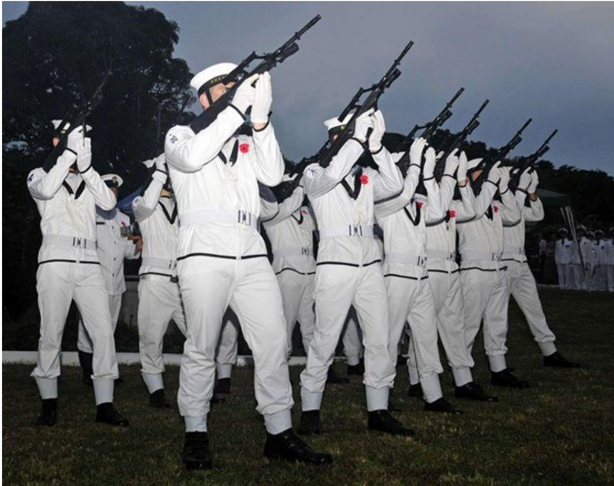
Військовослужбовці ВМС Нової Зеландії на урочистому заході, присвяченому Австралійському та новозеландському армійському корпусу (АНЗАК), 2011 р.

На сьогодні уряд Нової Зеландії намагається розробити комплексний підхід до формування політики безпеки для того, аби якнайширше врахувати свої як регіональні, так і глобальні інтереси. Важливу роль у формуванні цієї політики відіграє вплив глобалізаційних процесів, які створюють нову реальність для країни, актуалізують велику кількість загроз і спонукають до співробітництва з партнерами.