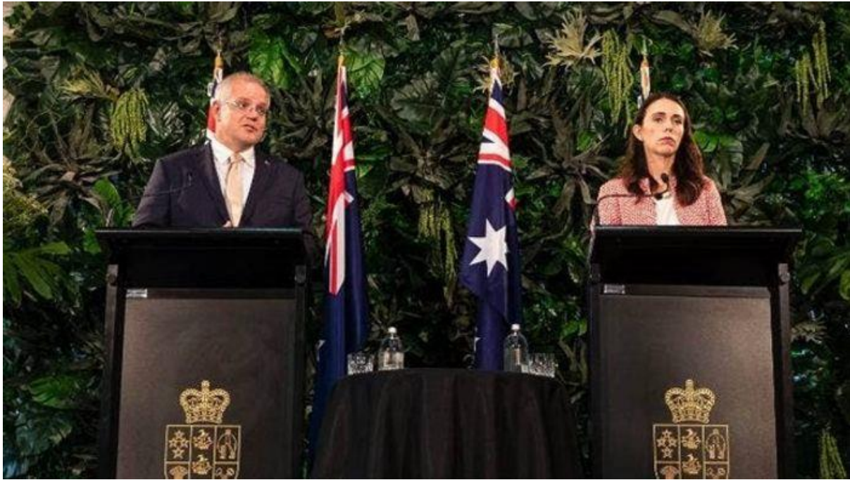
Прем'єр-міністр Австралії Скотт Моррісон (ліворуч) та Прем'єр-міністр Нової Зеландії Джасінда Ардерн (праворуч) 2019 р.

Активізація співпраці між Австралією, Британією та Америкою не оминула й політичні кола Російської Федерації. Міністерство закордонних справ держави висловило занепокоєність щодо негативного впливу AUKUS на регіональну безпеку, авторитет АСЕАН, та на можливість потенційного розгортання гонки озброєнь. Хоча AUKUS безпосередньо не спрямований проти Росії та не зачіпає її життєво важливих інтересів, Москва не виключає, що альянс може в перспективі збільшити амбіції західних союзників на домінування в Тихоокеанському регіоні й тому ставиться до нього скептично. Будь-яке істотне посилення впливу західних країн є неприпустимим в очах Кремля.