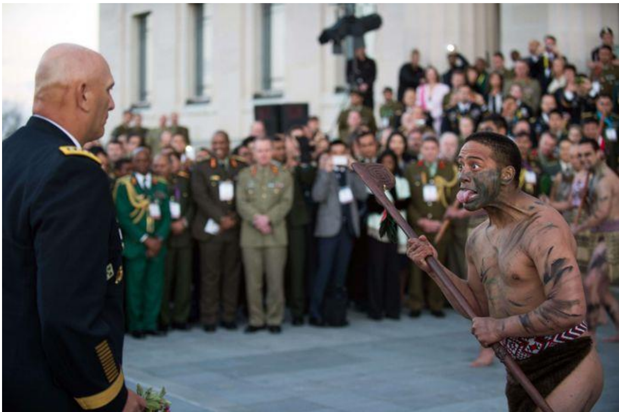
Традиційна для народу Маорі церемонія зустрічі гостей «пофірі». На фото: колишній командувач штабу сухопутних військ США Раймонд Одіерно, 2013 р.

Важливим питанням для Нової Зеландії в цьому контексті є відстоювання власних інтересів та збереження свого унікального зовнішньополітичного курсу в умовах повторного, більш активного залучення Британії та США до Азійсько-Тихоокеанського регіону. Складно передбачити, які нові кроки та ініціативи можна очікувати від США та їхніх союзників у конфронтації з Китаєм, проте Вашингтон, вірогідно, чинитиме тиск на Веллінгтон із метою залучення острівної держави в протистояння з Піднебесною. Крім цього, тісний зв'язок між Австралією та Новою Зеландією також породжує побоювання, що у випадку агресивних дій Китаю щодо Канберри новозеландському уряду доведеться надати військову допомогу союзнику.