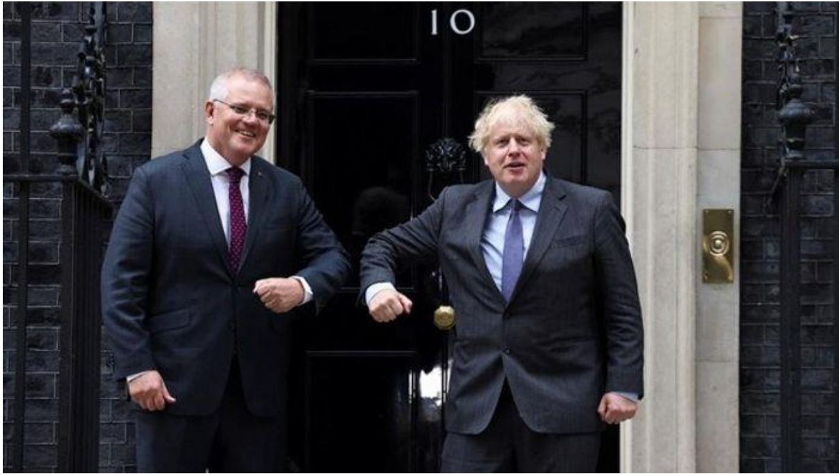
Прем'єр-міністри Австралії Скотт Моррісон та Сполученого Королівства Борис Джонсон, Червень 2021.

Однією з найважливіших ініціатив з безпекової політики, до яких залучена Австралія, є так званий Чотиристоронній діалог з безпеки (The Quad). Це – стратегічний діалог між Японією, Австралією, США та Індією, ініційований у 2007 р. японський прем'єром Сіндзо Абе, що ставить на меті обговорення й вирішення проблем, які становлять спільну загрозу для чотирьох країн. З 2017 р. ініціатива спрямована на створення вільного та інклюзивного простору в Індо-Тихоокеанському регіоні (ІТР), що насамперед передбачає протидію «китайській загрози», боротьбу з природними лихами та співпрацю у сферах досягнення свободи торгівлі, верховенства права й свободи мореплавства. Так, в листопаді минулого року члени партнерства провели в Аравійському морі військові навчання Malabar , спрямовані на координацію морських і повітряних сил чотирьох держав у випадку воєнних дій в Індійському океані.