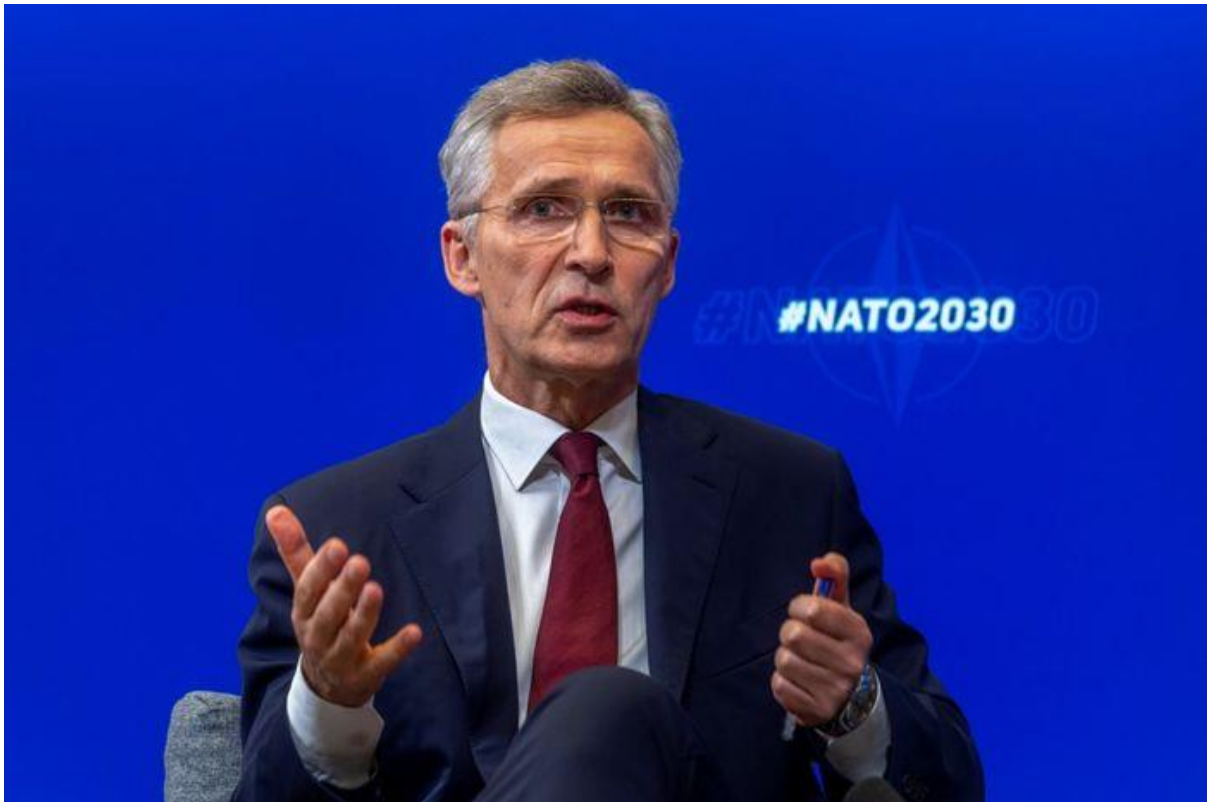
Генеральний секретар НАТО презентує стратегію НАТО 2030. NATO

Тому 4 грудня 2019 року під час ювілейного, присвяченого 70-й річниці створення НАТО саміту в Лондоні лідери Альянсу звернулися до Генерального секретаря з проханням розпочати NATO Reflection Process щодо зміцнення військово-політичного союзу. Ідея ініціативи НАТО2030 полягає в тому, як Альянсу слід діяти, щоб адаптуватися до нових викликів. Одне з головних завдань – політично використовувати НАТО, а також враховувати всі питання, які впливають на безпеку й використовувати військові, невійськові, економічні та дипломатичні інструменти.