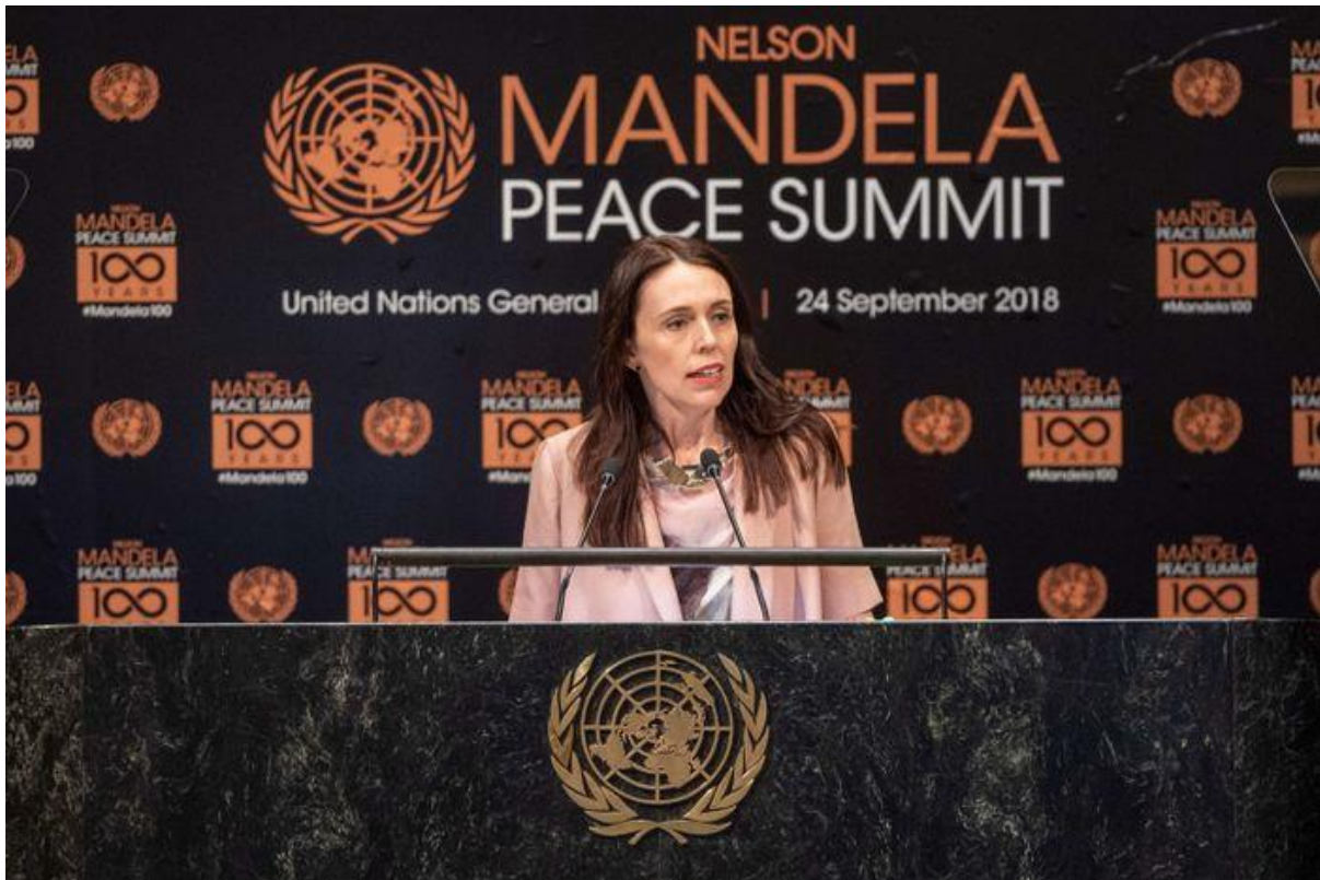
Виступ прем'єр-міністерки Нової Зеландії Джасінди Ардерн в ООН, 2018 рік.

Наголошуюється і на активізації співробітництва з регіональними партнерами в цій сфері, зокрема з Австралією.