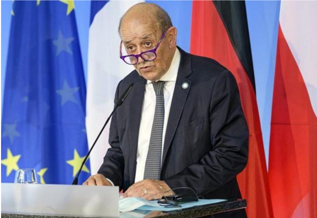
Міністр закордонних справ Франції Жан-Ів Ле Дріан у місті Веймар, Німеччина. 10 вересня 2021 р.

Країни-підписантки тривалий час вдало приховували інформацію про створення AUKUS аж до моменту його офіційного запуску. Несподівана поява такого альянсу застала зненацька не тільки держави Азійсько-Тихоокеанського регіону, а й країни далеко за його межами. Реакція на цю подію була суперечливою й спричинила значні дискусії про доцільність створення такого об'єднання.