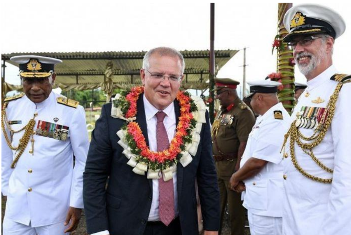
Візит Скотта Моррісона на Фіджі. Січень 2019.

Стратегія Австралії в Океанії, так звана Pacific Step-Up Policy, котра є одним із зовнішньополітичних пріоритетів країни, передбачає постійне поглиблення партнерства з тихоокеанськими країнами. Під час свого візиту до Вануату та Фіджі у січні 2019 р. прем'єр-міністр Моррісон оголосив про те, що Канберра збільшуватиме свої інвестиції в Океанію. Сюди варто віднести й реконструкцію морської бази Папуа – Нової Гвінеї на острові Манус, і відбудову табору для тренування миротворців та для біженців на Фіджі, і створення в серпні 2019 р. Австралійського фонду фінансування інфраструктури в Тихому океані (AIFFP).