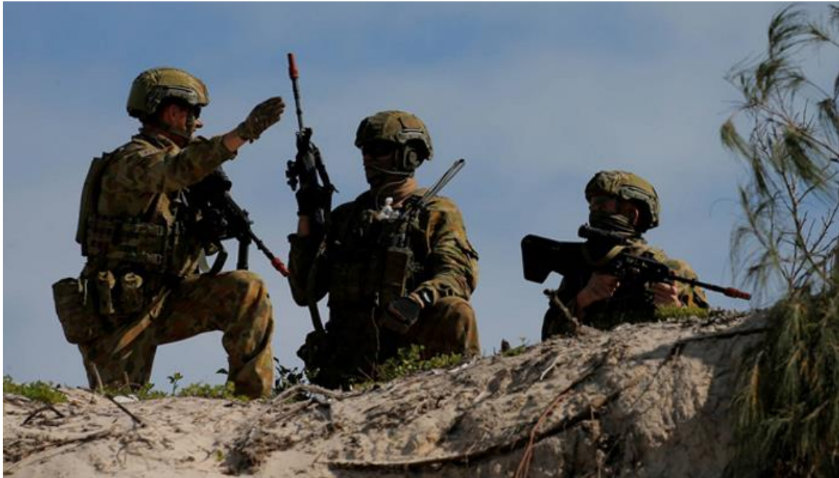
Австралійські військові під час навчань Talisman Saber, Липень 2017.

Таке інтенсивне співробітництво між Австралією та США обумовлюється не лише спільними ліберальними цінностями, що поділяють дві демократії. Для Австралії союзництво із США, державою, котра щороку асигнує понад 700 млрд доларів свого бюджету на оборону, є гарантією стабільності та безпеки в південно-східній частині ІТР. Окрім КНР, яка дедалі більше посилює свій вплив на країни Океанії, потенційним джерелом загрози, з точки зору Канберри, можуть бути азійські держави, у яких діють терористичні групи. Зокрема, небезпідставним є побоювання щодо бойовиків Ісламської Держави, котрі 3 роки тому організували теракти в Індонезії й можуть радикалізуватися та підтримувати ісламістські настрої в регіоні. Занепокоєння викликає і ядерна загроза з боку КНДР.