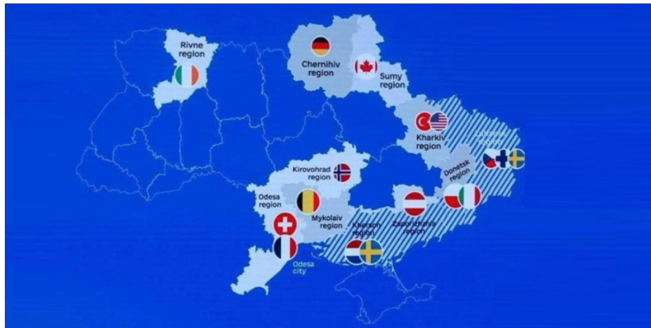
Рисунок 1: Карта зобов'язань партнерів у відбудові регіонів України 7

Використання регіонального підходу відбудови міжнародними партнерами вже було чітко окреслене прем'єр-міністром України Д. Шмигалем під час вищезгаданої Конференції в Лугано, де він презентував мапу України зі вказанням конкретних держав, які зобов'язалися відновлювати регіони: хтось – ціле місто, інший – конкретних інфраструктурний об'єкт, а третій – цілу галузь.