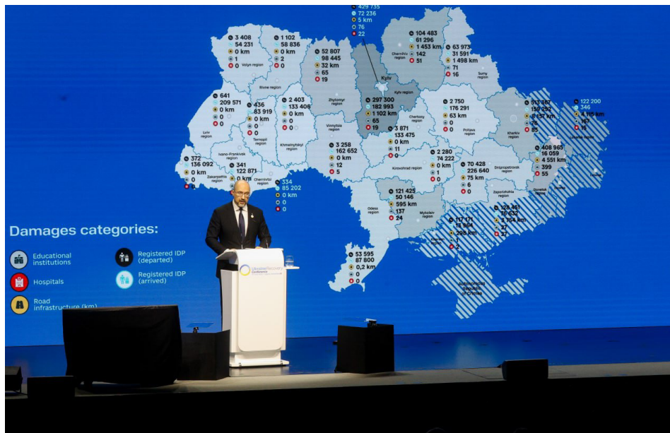
Рисунок 1: Карта ключових збитків війни за областями України 8

Однак реалії державних програм відбудови передбачають акцент на тих областях, які пережили бойові дії, що здається на перший погляд правильним (грунтуючись на принципі «соціальної справедливості» регіональної політики держав-членів Європейського Союзу). Така орієнтація центральної політики відбудови на вирівнювання дисбалансів – це підхід, який має на меті збільшення ефективності розвитку країни.