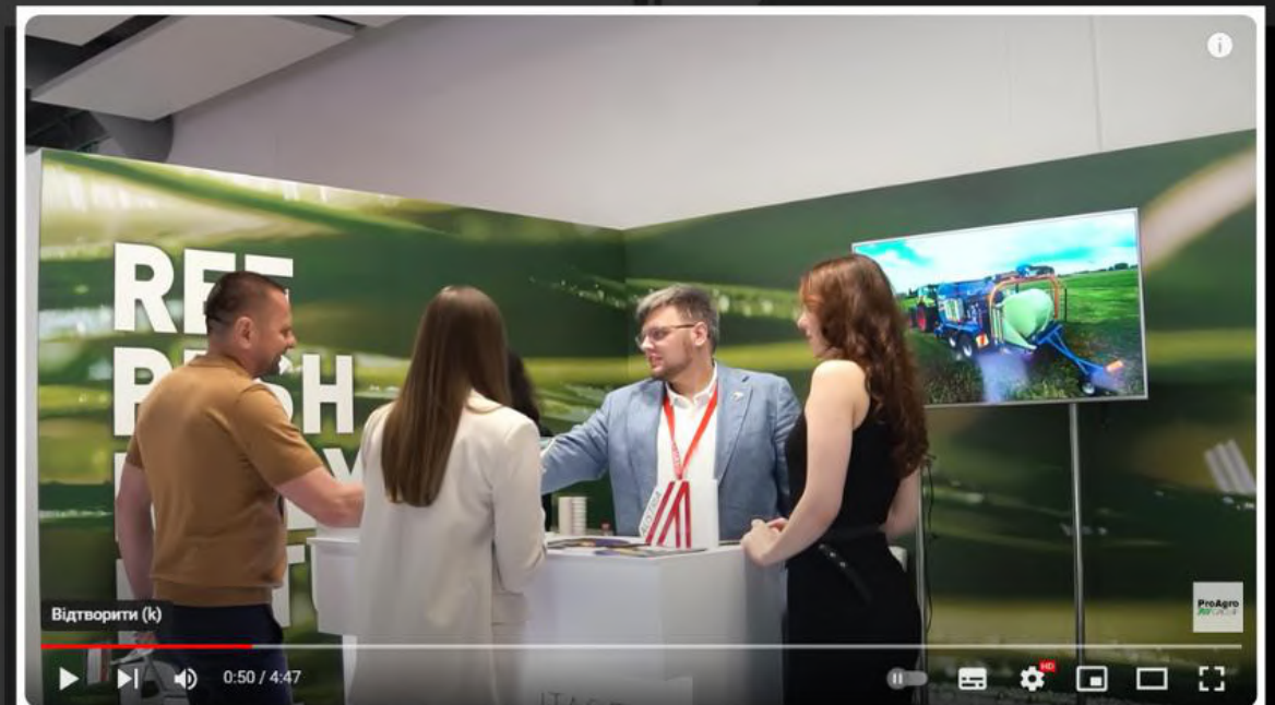
Ювілейний Grain Storage Forum ELEVATOR - головна агроподія року