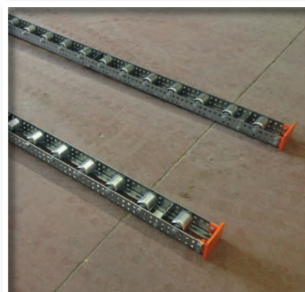
Rails palettes au sol