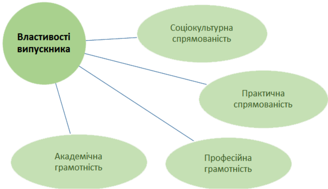
Рис. 2. Модель випускника ВСП «ФКЕПІТ К-ППІ»

Формування моделі випускника ВСП «Фаховий коледж економіки, права та інформаційних технологій» приватного закладу освіти «Кам'янець-Подільський податковий інститут», якій притаманні певні властивості, має бути однією із найважливіших складових діяльності закладу.