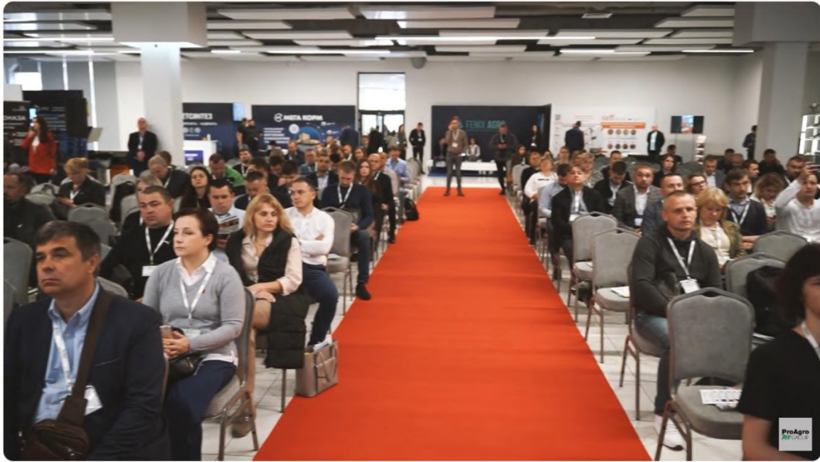
Український тваринницький саміт 2023: як це було?