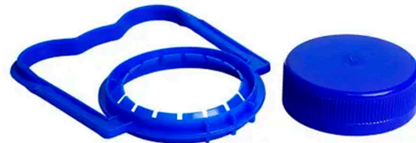
КРИШКА ТА РУЧКА ДО ПЛЯШОК