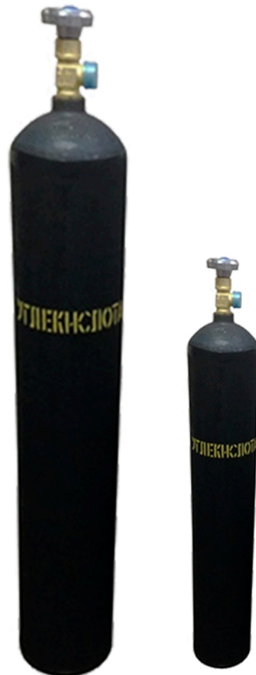
ВУГЛЕКИСЛОТА В БАЛОНАХ 20-6 КГ.