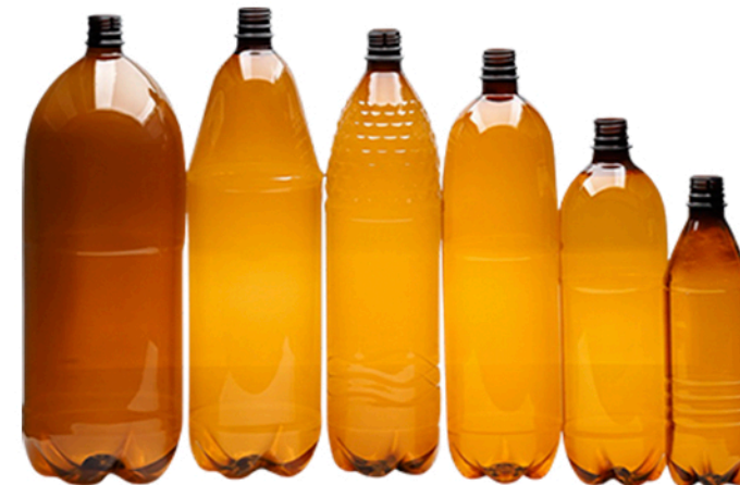
ПЕТ - ТАРА (РІЗНОГО ОБ`ЄМУ)