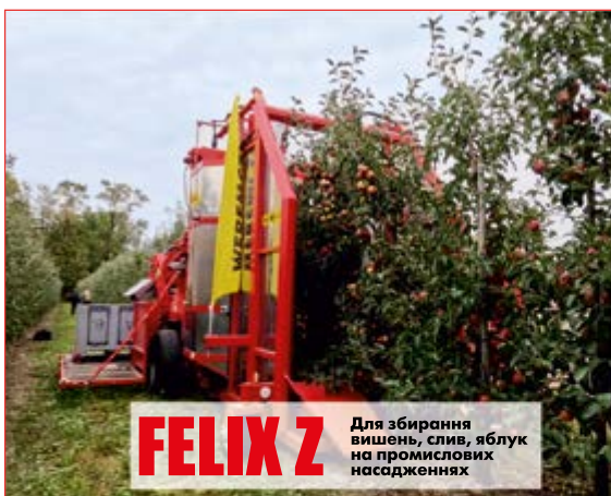
FELIX Z Для збирання вишень, слив, яблук на промислових насадженнях

Отже, машини МАЈА – чудове рішення для традиційних багаторічних садів, де дерева висаджують на відстані 2–3 метри, і вони мають щільну крону, досить товсті стовбури та гілки. Також це чудовий вибір для інтенсивних садів зі щільною посадкою і схемою, оптимальною для механізованого збирання. Клієнтам, які вирощують сади площею кілька десятків гектарів, або тим, хто планує розширити свою діяльність у напрямку інтенсивного виробництва фруктів, фахівці Weremczuk рекомендують комбайни серії FELIX, які вже кілька років успішно працюють на багатьох плантаціях Європи.