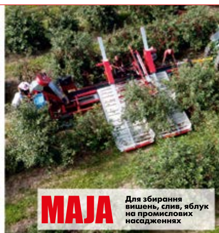
МАЈА Для збирання вишень, слив, яблук на промислових насадженнях