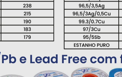
Barras Extralloy (alta pureza)