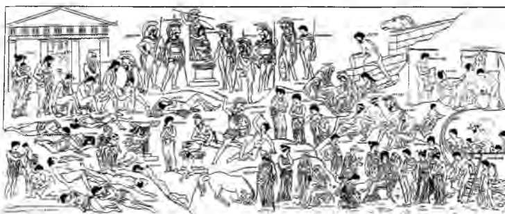
Полігнот. Аїд. Лесха кнігян у Дельфах. Реконструкція Мстислава Фармаковського, 1902