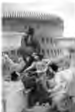
Л. Альма-Тадема. Колізеї, олія, 1896