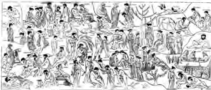
Полігнот. Узяття Іліона греками. Лесха кнігян у Дельфах. Реконструкція Мст. Фармаковського, 1902