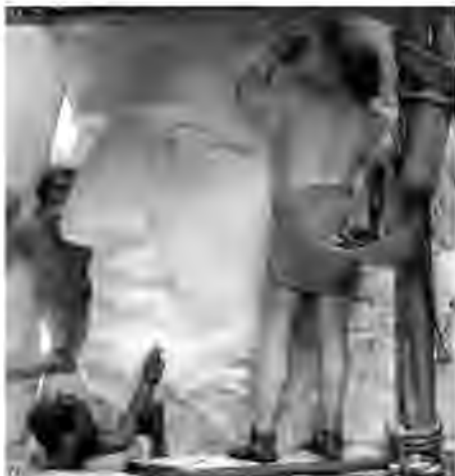
Л. Альма-Тадема. Скульптор в античному Римі, олія, 1890-і