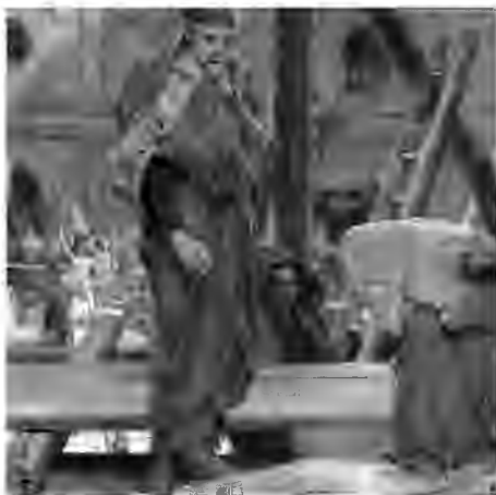
Л. Альма-Тадема. Античний архітектор, олія, 1880-і