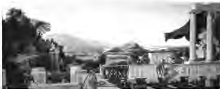
Карл Фрідріх Шінкель. Еллінський сон, 1820, Національний музей, Берлін