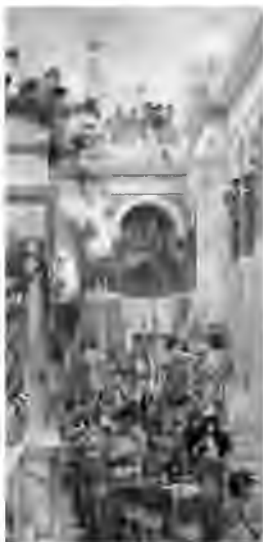
Л. Альма-Тадема. Весна, олія, 1894