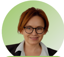
Марина Слободніченко Заступник Міністра охорони здоров'я України з питань європейської інтеграції