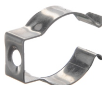
Металева кліпса для лампи T8