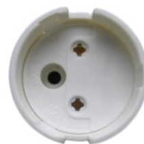
Клема для лампи T8

+38 057 752 03 10 +38 057 752 03 25 info@ledlife.com.ua www.ledlife.ua