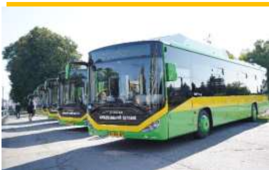
20 автобусних маршрутів 63 низькопідлогові автобуси