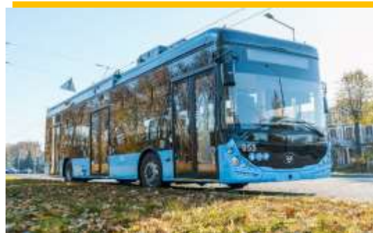
21 тролейбусний маршрут 115 тролейбусів