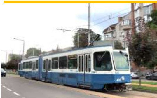
6 трамвайних маршрутів 69 трамваїв