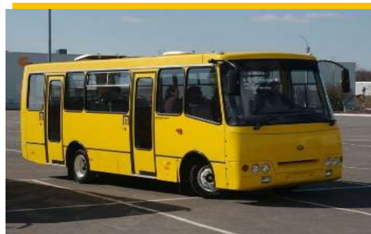
28 маршрутів маршрутних таксі 209 автобусів