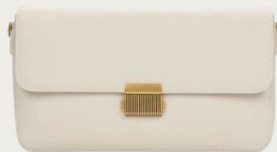
Estro, 4 299 ₴