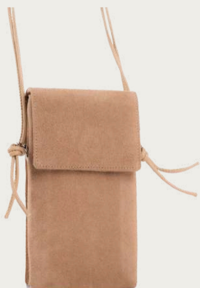
Bottillon, 1 890 ₴