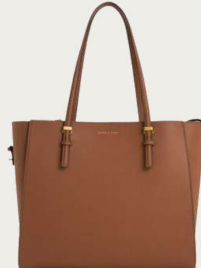
Charles & Keith, 6 704 ₴