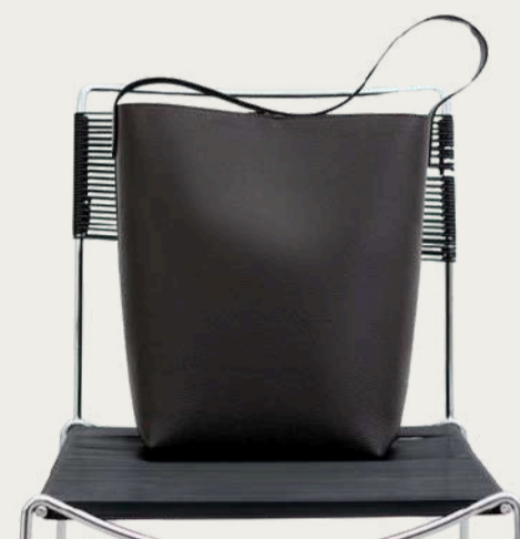
The Lace, 4 990 ₴