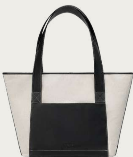
Нвоуа, 8 200 ₴