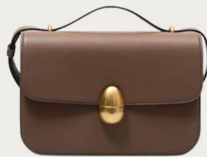
NEOUS, 42 400 ₴