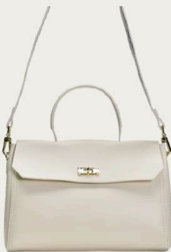
Vitto Rossi, 4 368 ₴