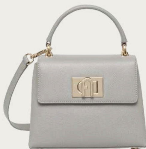
Furla, 15 999 ₴