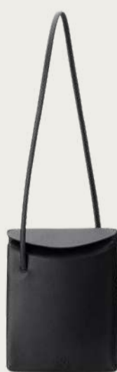
Нвоуа, 7 200 ₴