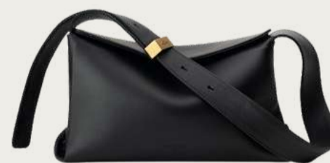
Нвоуа, 9 500 ₴