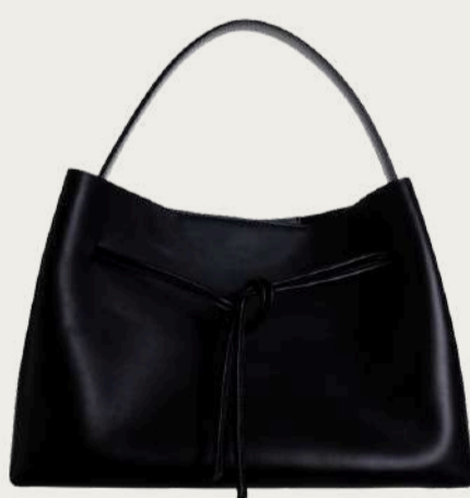
Juna, 9 200 ₴