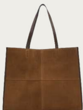
Mango, 4 799 ₴