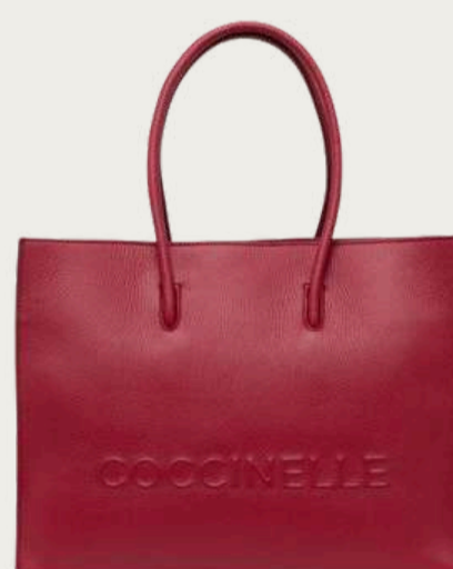
Coccinelle, 12 399 ₴