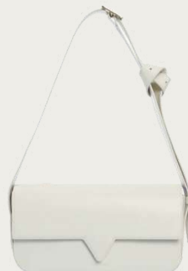
Vikele, 10 700 ₴