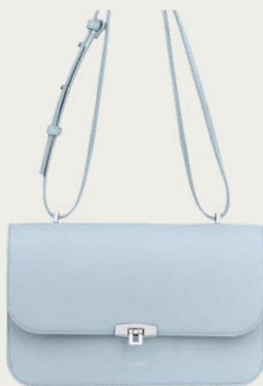
Vikele, 20 600 ₴