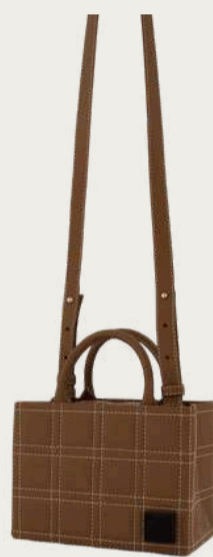
Lona Prist, €650