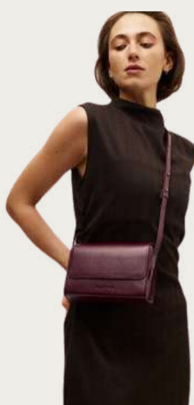
Mastak, 4 300 ₴