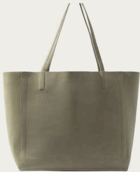
Kachorovska, 9 500 ₴