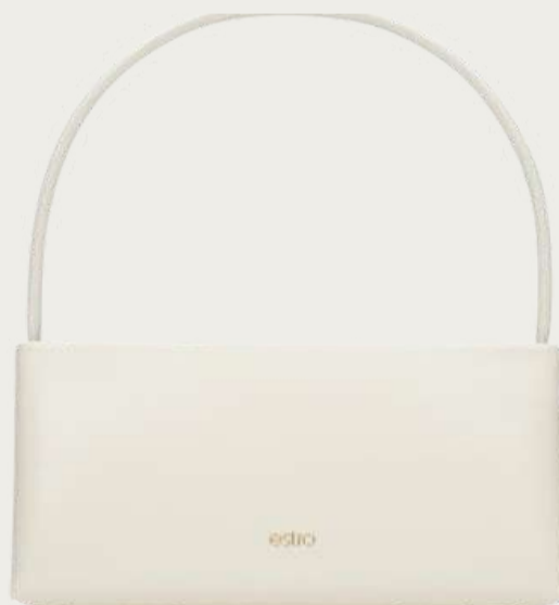
Estro, 3 299 ₴