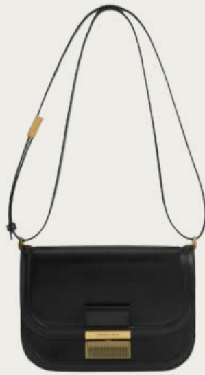
Charles & Keith, 5 463 ₴