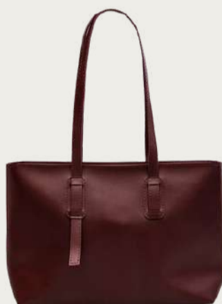
Серур, 1 599 ₴