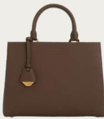
Charles & Keith, 6 335 ₴