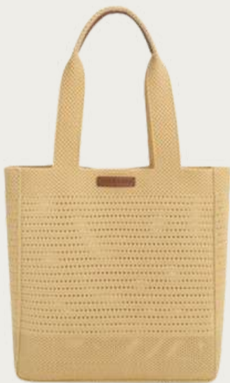
Charles & Keith, 5 904 ₴