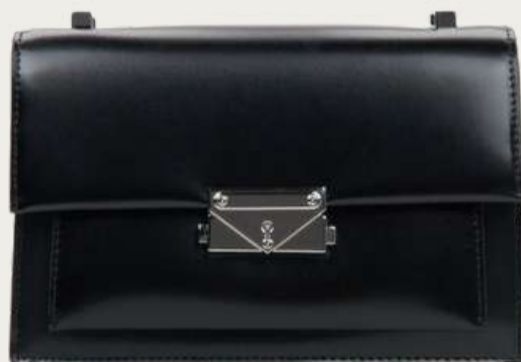
Estro, 4 199 ₴