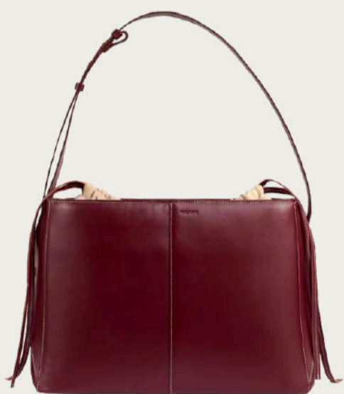
Team's, 13 800 ₴