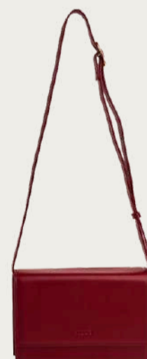
Tueam's, 6 400 ₴