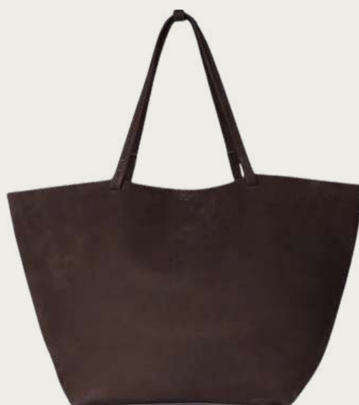
The Row, 170 749 ₴