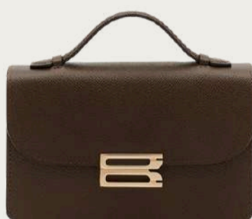
Victoria Beckham, 40 586 ₴