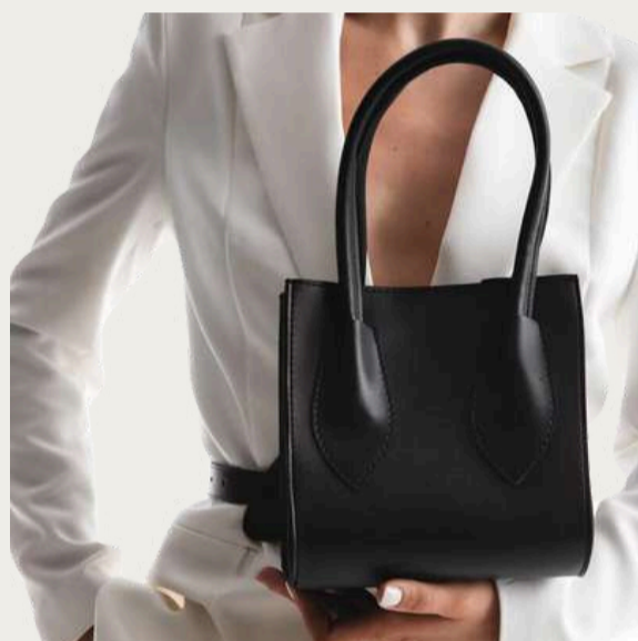
Серур, 1 399 ₴