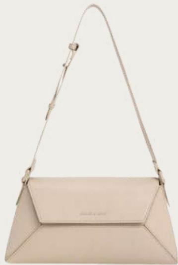
Charles & Keith, 5 084 ₴