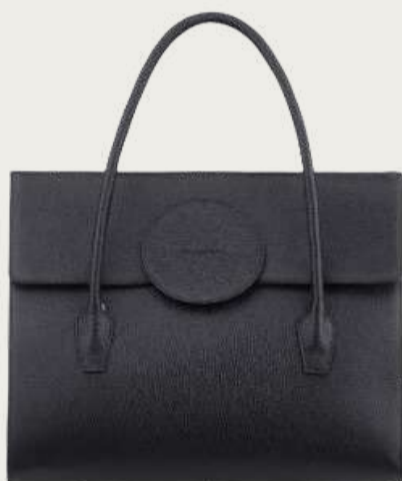
Vikele, 19 700 ₴