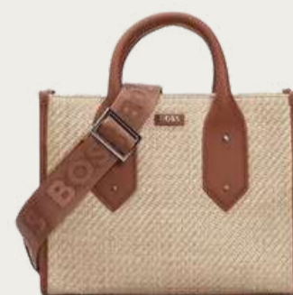
BOSS, 11 110 ₴