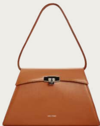
Vikele, 14 700 ₴