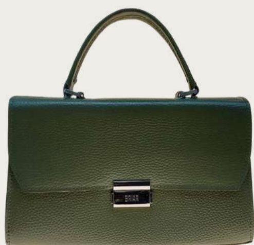
Briar, 3 197 ₴