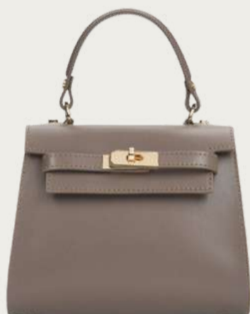
Estro, 4 989 ₴