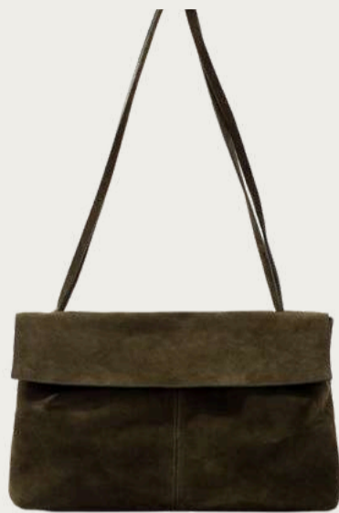
Kachorovska, 10 500 ₴