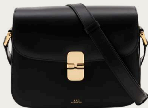
A.P.C., 39 216 ₴