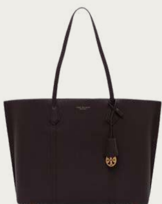
Tory Burch, 18 899 ₴