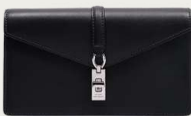
Stuart Weitzman, 23 950 ₴