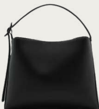
Mango, 1 699 ₴