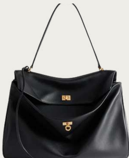
Balenciaga, 309 786 ₴