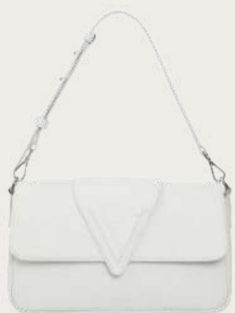
Vikele, 20 600 ₴