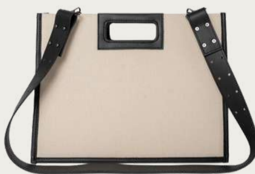
Coosh, 3 580 ₴