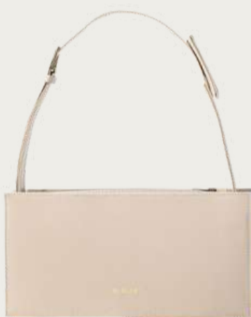
Bagllet, 7 800 ₴