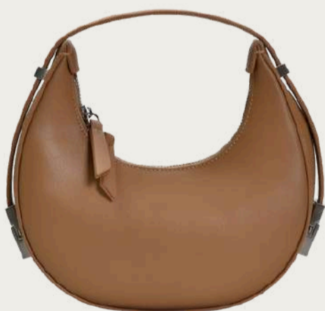
Vitto Rossi, 4 568 ₴