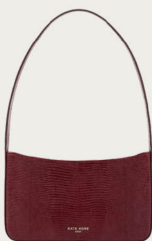
Kate Kore, 9 000 ₴