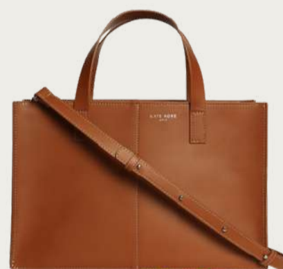
Kate Kore, 13 000 ₴