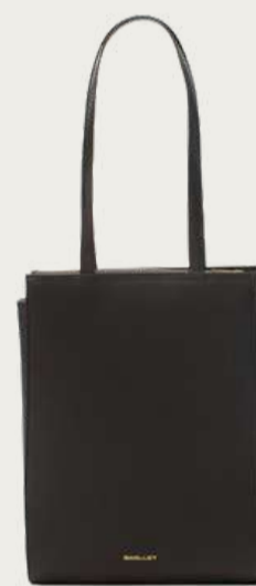
Bagllet, 11 000 ₴