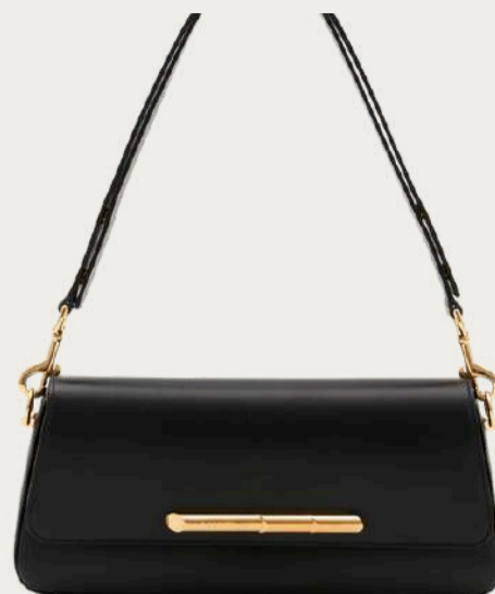
Lanvin, 95 250 ₴