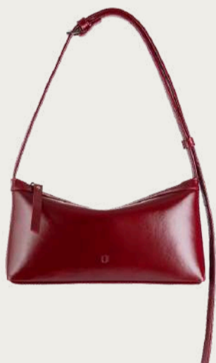
Nukot, 5 800 ₴