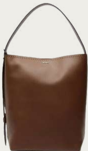
Max Mara, 57 950 ₴