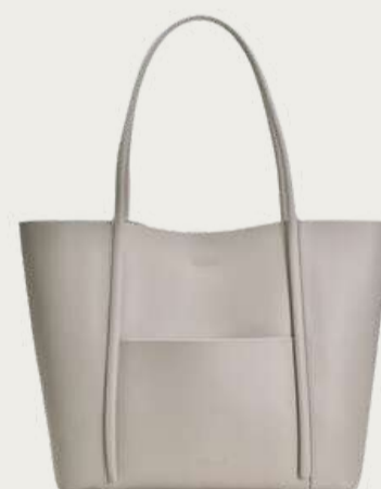
Vitto Rossi, 4 368 ₴