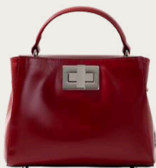
Kachorovska, 9 200 ₴