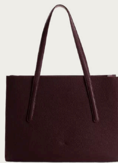
Juna, 6 500 ₴