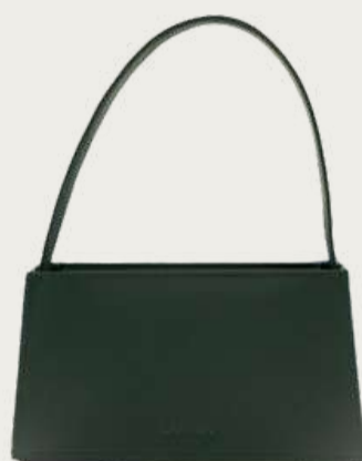
Mastak, 5 900 ₴