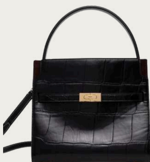
Tory Burch, 53 199 ₴