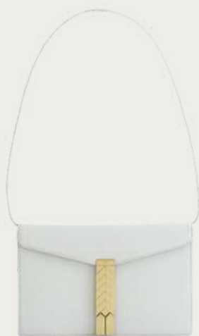
Bevza, 27 370 ₴