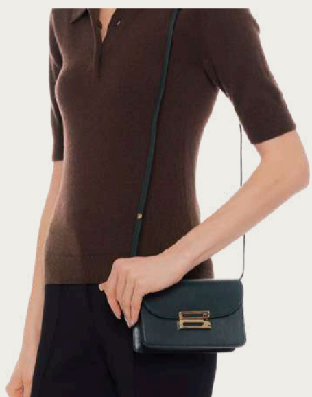
Victoria Beckham, 33 872 ₴