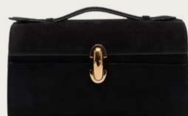
Savette, 60 894 ₴