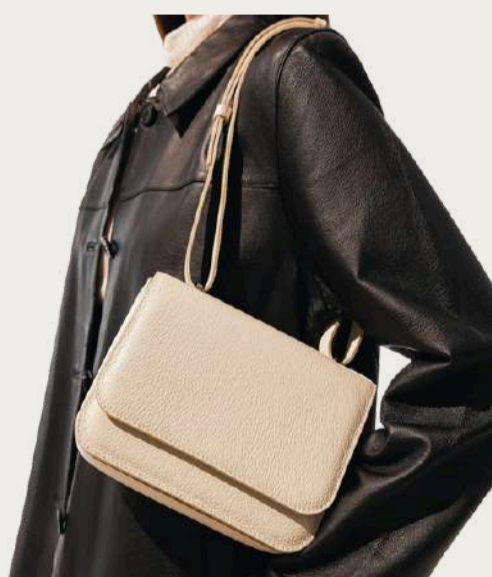
Juna, 4 240 ₴