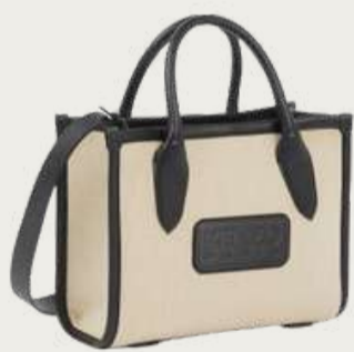
Kenzo, 33 510 ₴