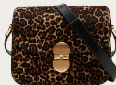
A.P.C., 37 152 ₴