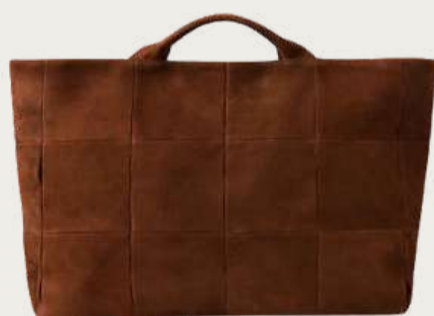
Kulakovsky, 21 259 ₴