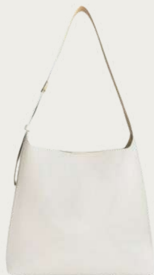
Charles & Keith, 5 720 ₴