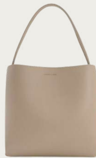
Charles & Keith, 5 720 ₴