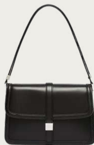
Max Mara, 72 040 ₴