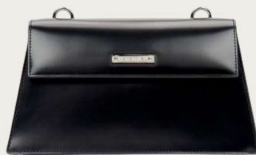
Cromia, 10 699 ₴