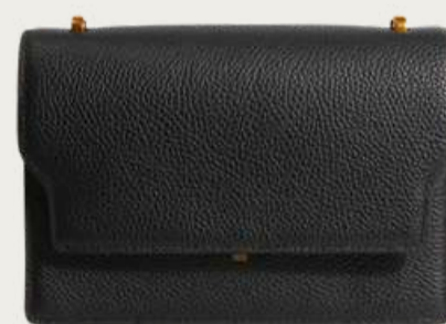
Verbena, 6 630 ₴