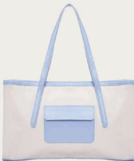
Juna, 3 250 ₴