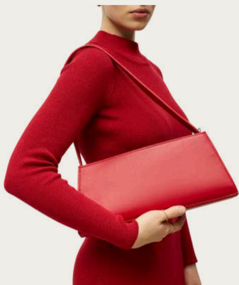
Paraya, 1 490 ₴