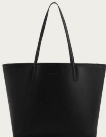
Charles & Keith, 6 519 ₴