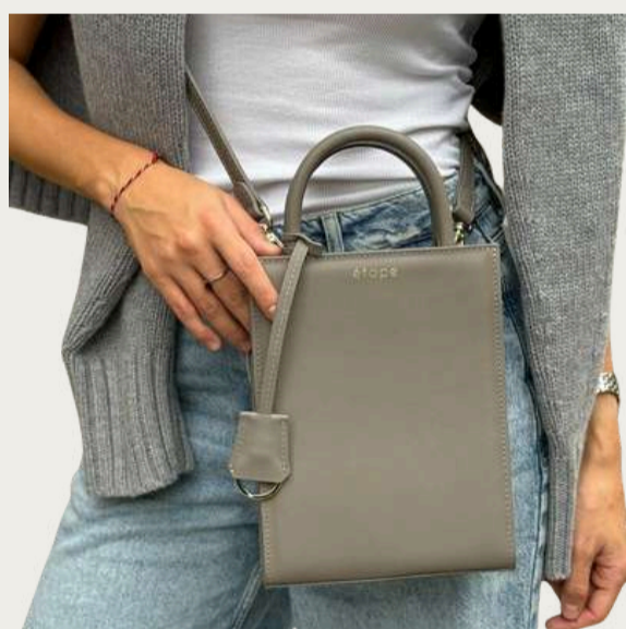
Etape, 7 990 ₴