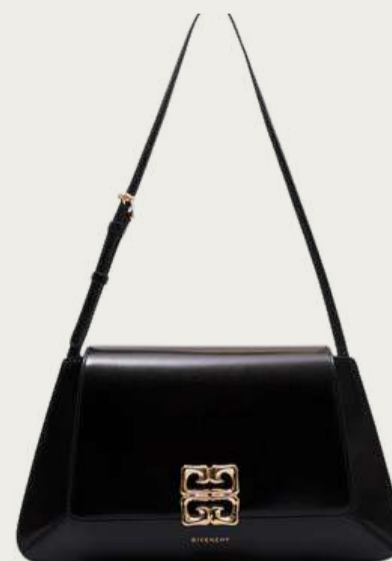
Givenchy, 94 555 ₴