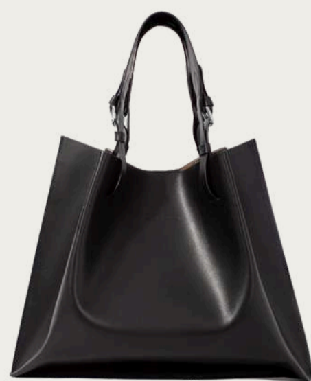
Kachorovska, 12 500 ₴