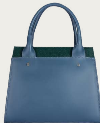
Briar, 2 997 ₴