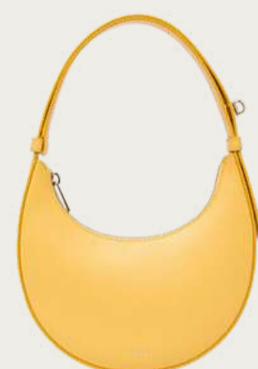
Furla, 7 699 ₴