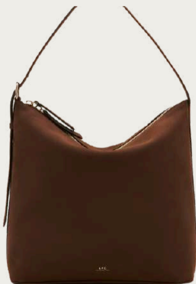
A.P.C., 28 380 ₴