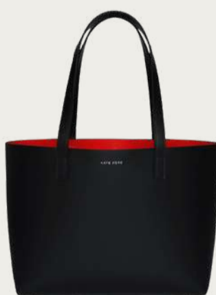
Kate Kore, 12 000 ₴