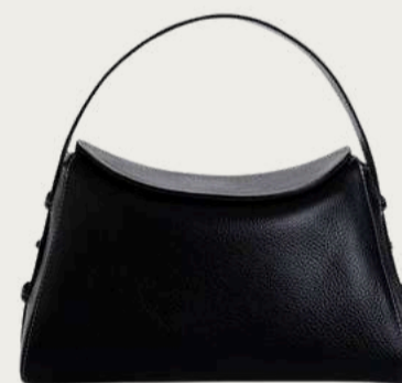
Juna, 5 680 ₴