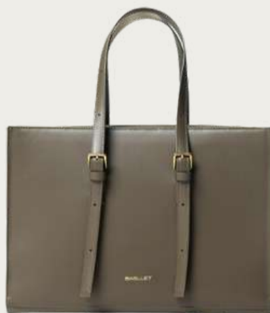
Bagllet, 10 600 ₴