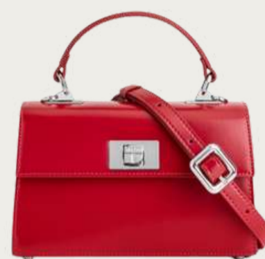
Fidelitti, 4 989 ₴