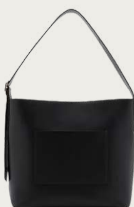
Mango, 8 999 ₴