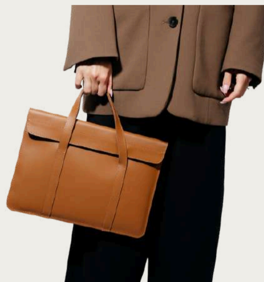
Wave, 1 700 ₴