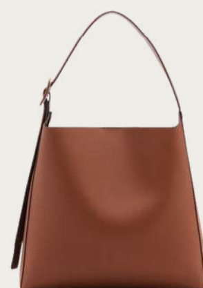
Mango, 2 299 ₴