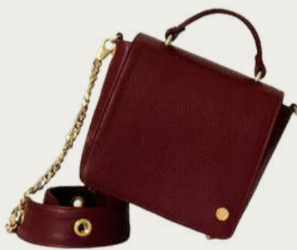
Ozerianko, 6 950 ₴