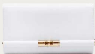
Dolce&Gabbana, 79 343 ₴