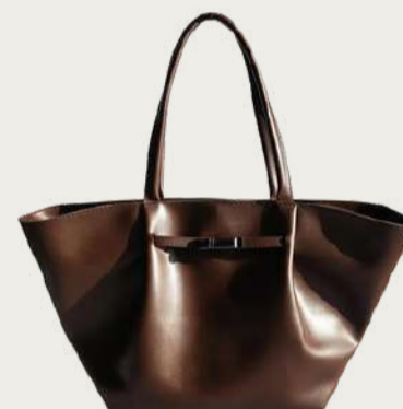
Серур, 2 599 ₴