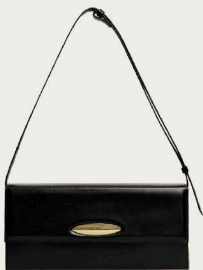
Team's, 9 800 ₴