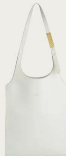
Bevza, 34 730 ₴