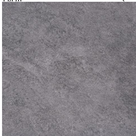
456615/GRES COLORADO GRIGIO RECT 597x597x8