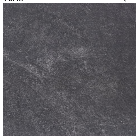
456616/GRES COLORADO NERO RECT 597x597