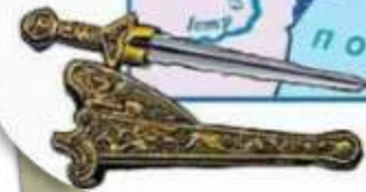
Меч із півнями зі скифського кургану Тосста могила, V ст. до н. е.