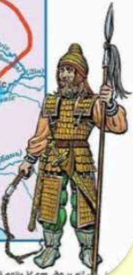
Скифський воїн V ст. до н. е.