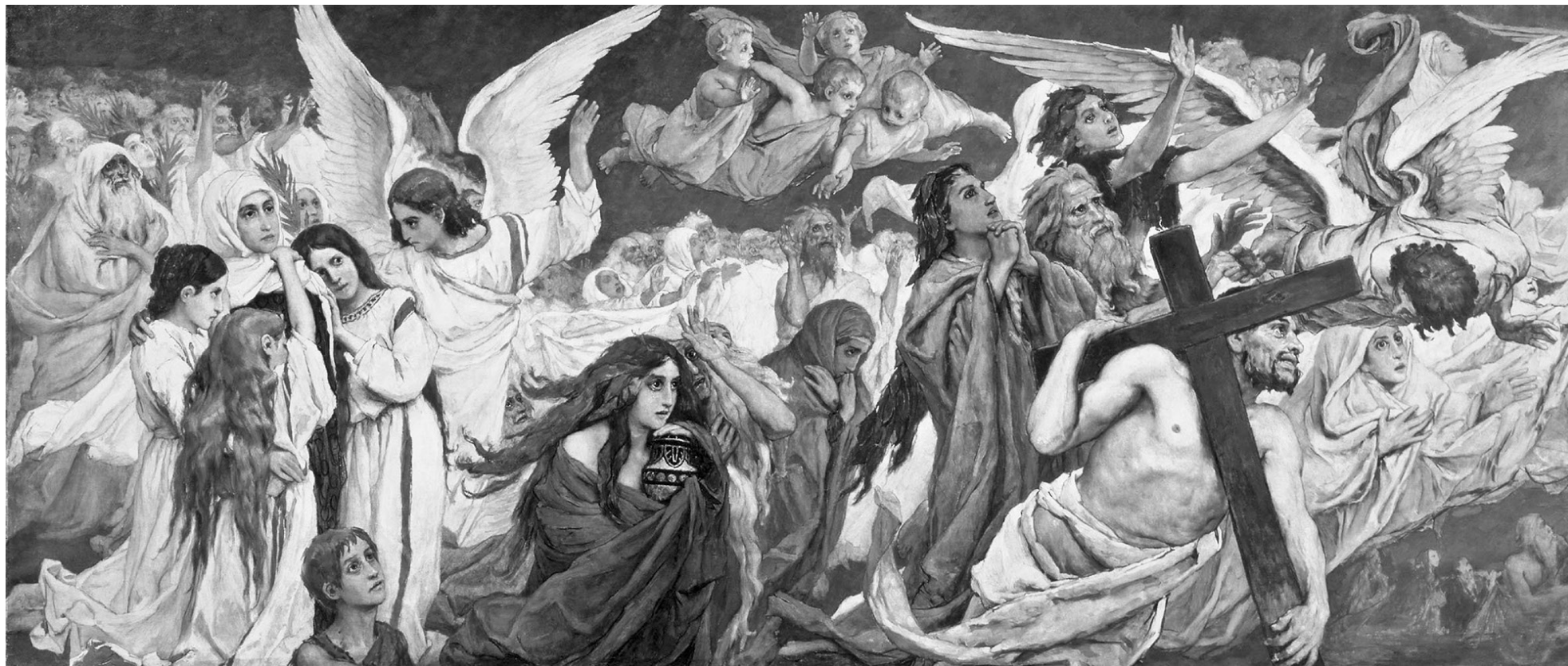
В.Васнецов. Триптих «Радість праведних про Господа. Переддень раю». Ескіз розпису Володимирського собору в Києві