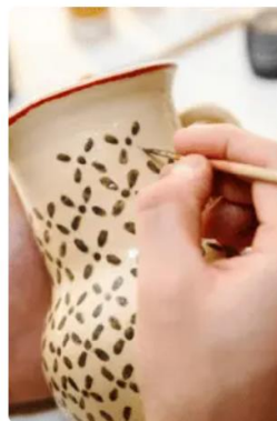
Actividades a bordo