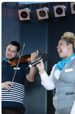
Música y magia