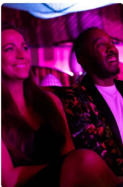
Sala de espectáculos