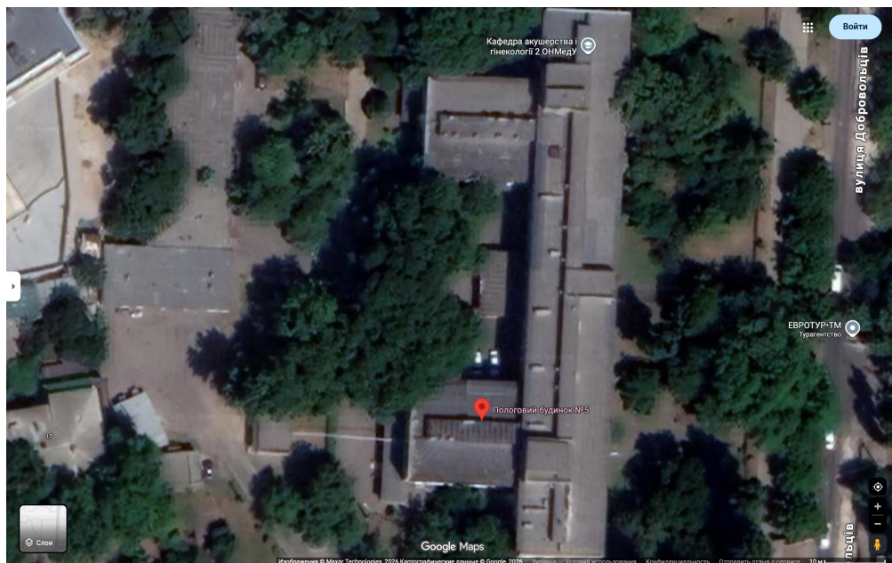
Figure 1. Aerial view of Odessa Maternity Hospital No. 5 prior to the Shahed drone attack of 28 March 2026.