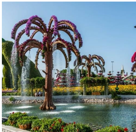
Фонтан и сад