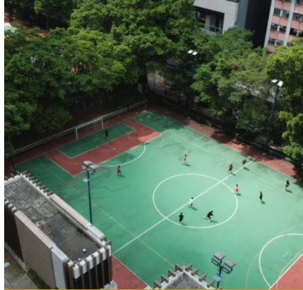
Теннисный и футбольный корт