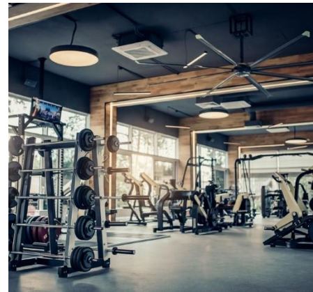
Современный тренажерный зал