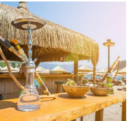
Кальянная и бар