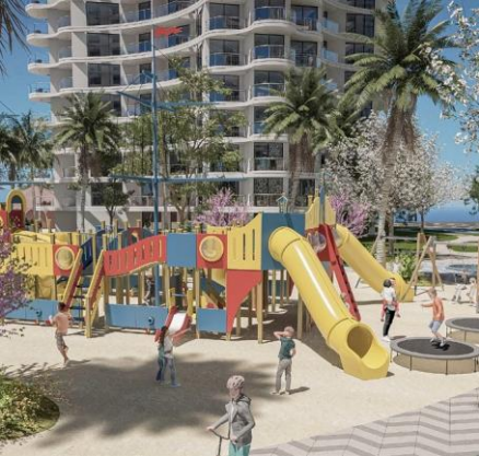
Детская игровая площадка