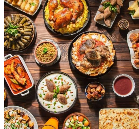
Ресторан аутентичной арабской кухни