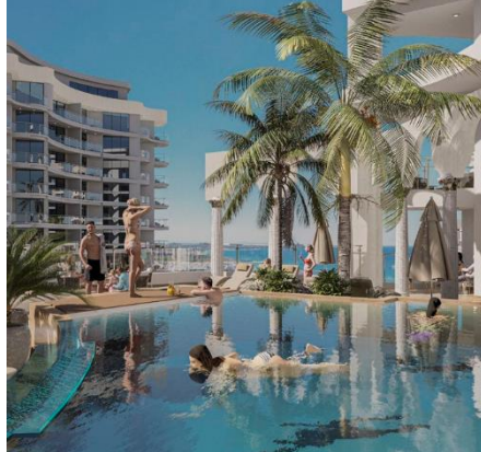
Бассейн для семейного отдыха и досуга