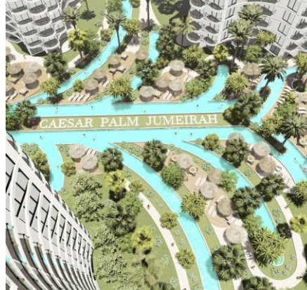
Уникальный бассейн пальма