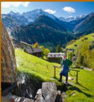
SLOW FOOD TRAVEL