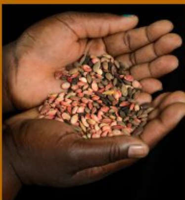
SEEDS AND GMOS