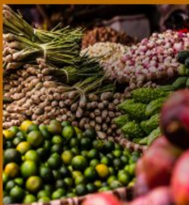
FOOD PATHS NETWORK