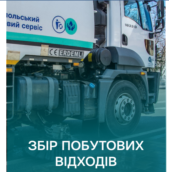
ЗБІР ПОБУТОВИХ ВІДХОДІВ

Відновлення системи вивезення і захоронення відходів