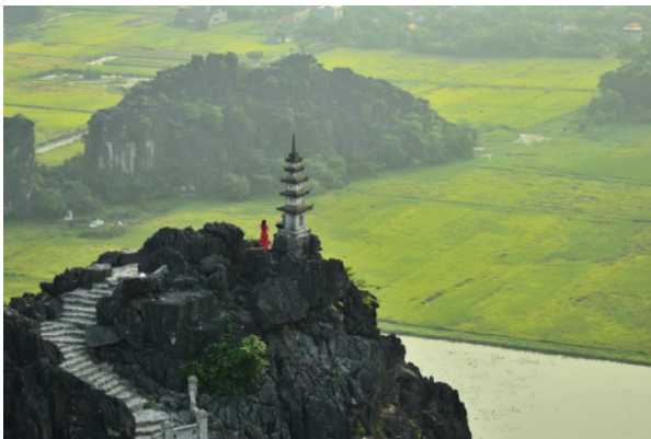
Заселення у готель м.Нінь Бінь.