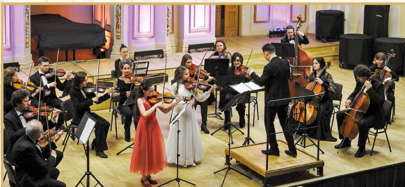
Виступ учнів Ліцею з Академічним камерним оркестром «Віртуози Львова»