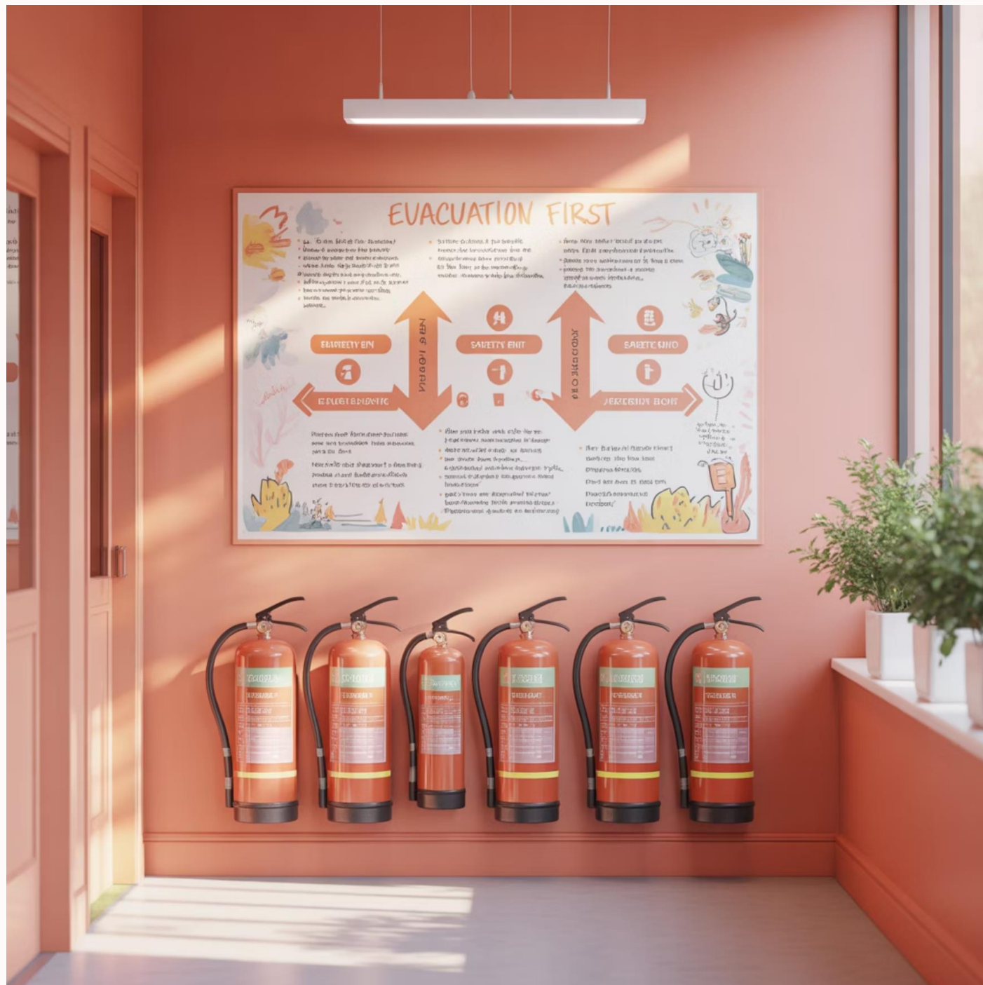
Пожежна безпека та евакуація

Основні елементи пожежної безпеки, організації спеціалізованої дії у разі виникнення надзвичайної ситуації